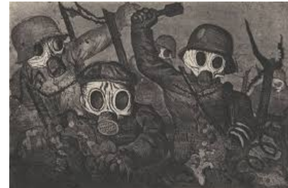
Otto Dix, 1924: „Sturmtruppe geht unter Gas vor“