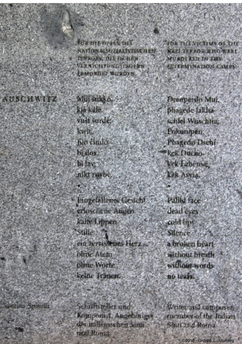
Stele mit dem Gedicht „Auschwitz“ des italienischen Roma Santino Spinelli.