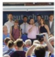
Nationalhymne: Die AfD-Redner sangen auf einem Bühnenanhang.

Nach weiteren Rednern, die weitestgehend vor Ort ihre Gegner „an die