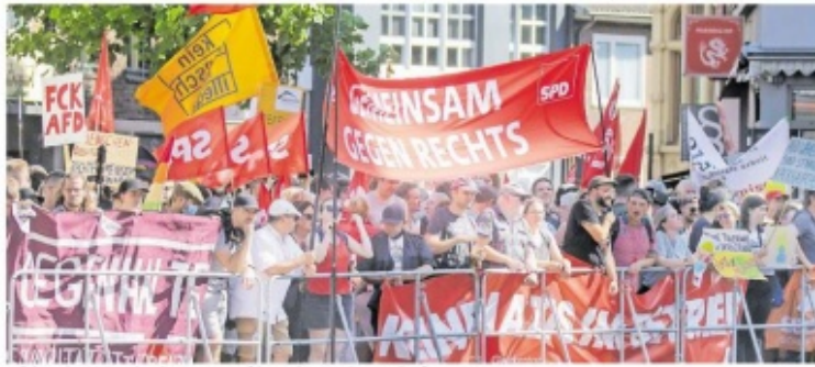
Auf Abstand: 1500 Menschen demonstrieren auf dem Aachener Markt gegen die AfD.

Rechter werfen der AfD „die härtesten Merkmale einer faschistischen Partei“ vor. Sie warnen vor Rassismus und Gewaltbereitschaft, empören sich über antidemokratische Ansichten und antideutsche Auswüchse. Auf vielen Bannern wird die Abscheu plakatiert: „AD – Adolfs falsche Demokratie“, „Nazi töter“, „FCK AfD“ steht unter anderem in